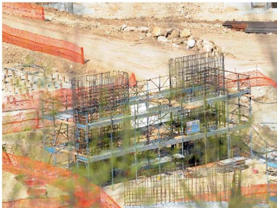
Il cantiere del megasvincolo, a Micigliano, in costruzione lungo il tratto di statale Salaria che da Rieti porta ad Ascoli Piceno a ridosso dell'abbazia dei Santi Quirico e Giulitta

l'esame della documentazione e delle verifiche in loco è risultato che al momento i lavori procedono nel rispetto delle norme e delle autorizzazioni ricevute».